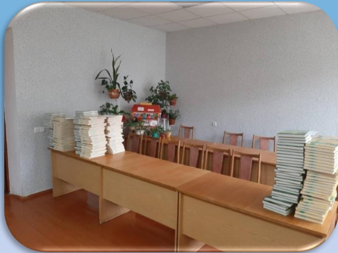
Фото читальної зали (до/після)